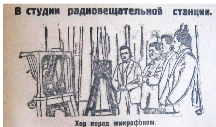
В студии радиовещательной станции.