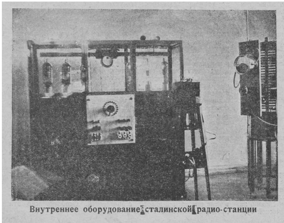
Внутреннее оборудование сталинской радио-станции

На этот акт никто даже внимания не обратил. Была спешка с установкой оборудования.